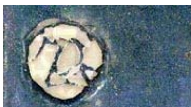
" Lune blessée "