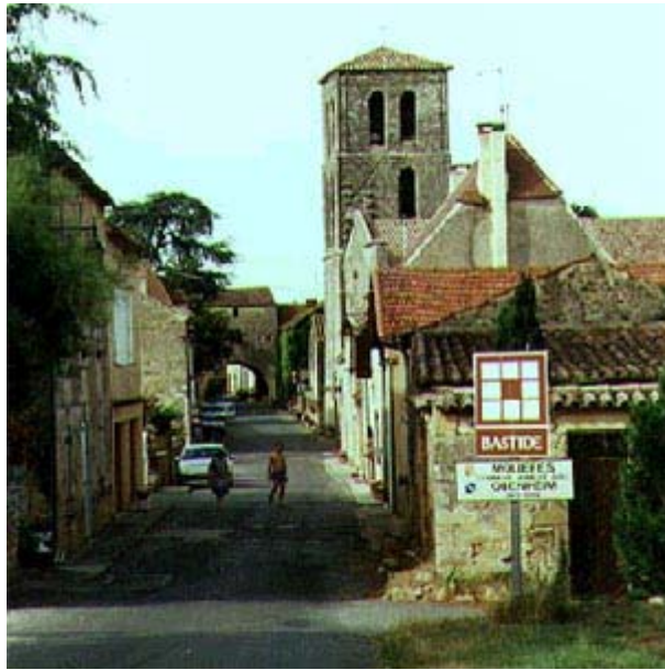
L'entrée de la bastide de Molières, par le chemin venant du Placial.