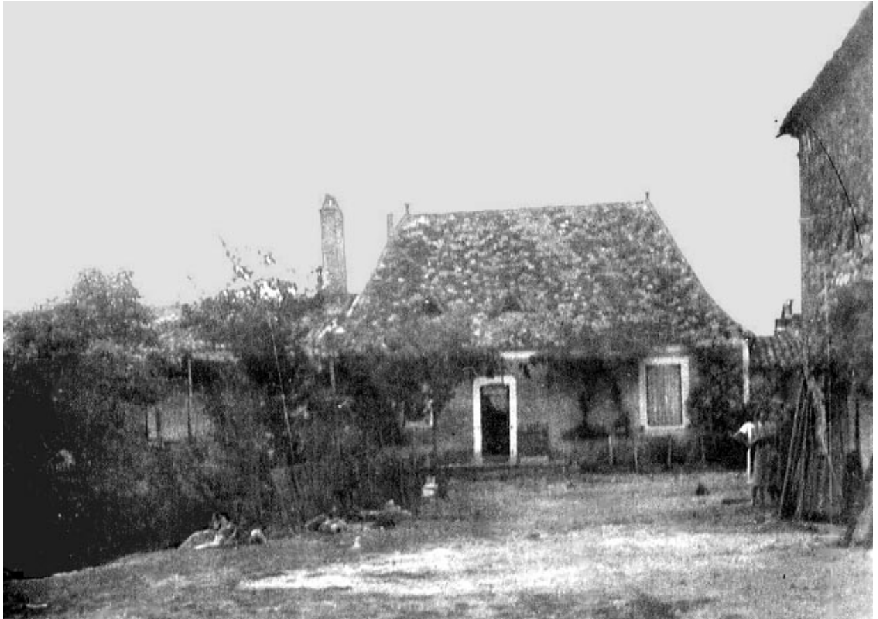
La ferme du Placial

Charles Franc sieur du Placial, frère d'Armand, "absent depuis longtemps" en 1713 semble avoir émigré, comme beaucoup de ses coreligionnaires, hors du royaume de France malgré les interdictions répétées de Louis XIV.